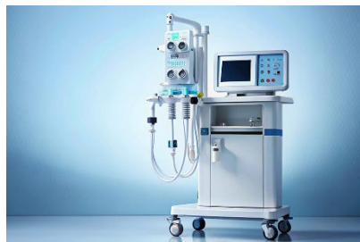
医療機器イメージ

鉄道車両や航空機のテーブルやパーテーション、袖仕切りなどに採用され、公共交通機関の利便性向上に寄与して参りました。