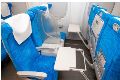
鉄道車両: テーブル・ドリンクホルダー・パーテーション