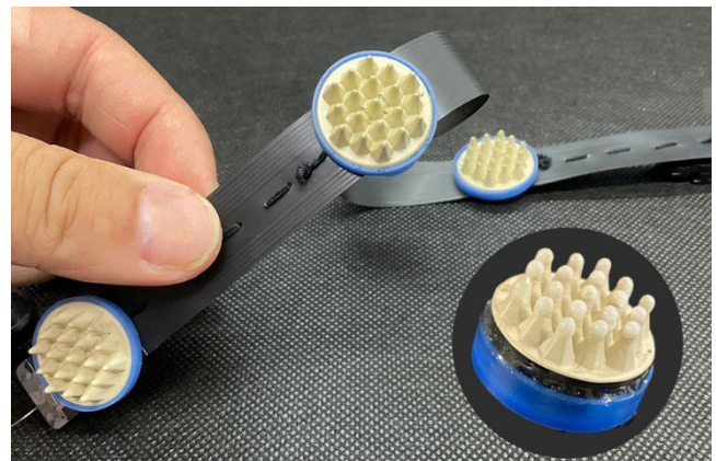
樹脂製柔軟ドライ電極(ハイドロゲル使用タイプ)

当社では、これまで金属電極並(約20kΩ)の低い接触抵抗で脳波を測定可能な樹脂製柔軟ドライ電極の開発に成功しています。この度、2020年に開発した脳波測定用樹脂製ドライ電極の先端にハイドロゲルを用いることで、頭の形や肌質を問わずに医療用レベルの脳波を測定できるデバイスを開発しました。本技術を用いたデバイスをてんかん患者の脳波測定に活用し、在宅医療の推進に貢献します。