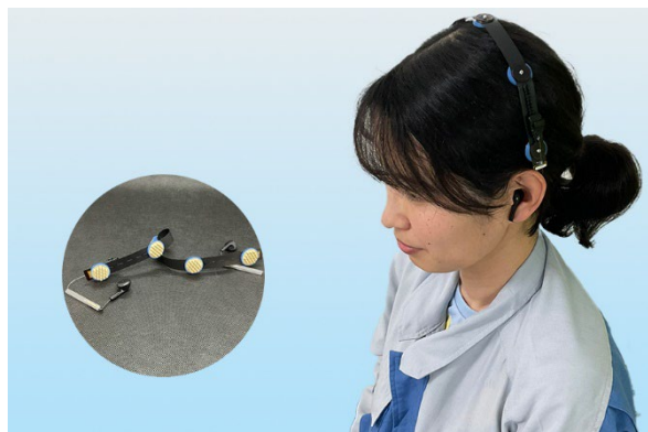
簡単装着で目立たないリボン型脳波デバイス