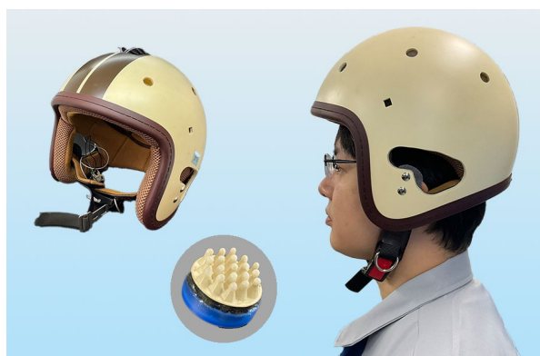
自動車の運転など、厳しい環境下でもモニタリング可能なヘルメット型脳波デバイス

その他開発中の製品 柔軟脳波電極をベース技術とし、用途に合わせたデバイスを設計・開発しています。