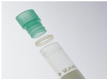
【インナーキャップ】