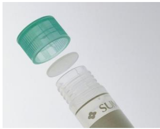
【アウターキャップ】