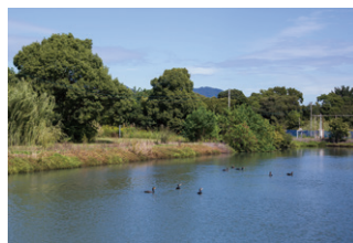
いこ もり ビオトープ 憩いの杜

徳川家康が幕藩体制を敷き、約300年という長寿政権を誇った江戸時代は、農業や産業の技術も向上し、物流も目覚ましく発達しました。江戸城を中心に、武士と商人や職人などの町人が暮らす、超過密で巨大な首都を形成していました。江戸市中では、1650年頃には、建設資材の材木の入手や人々が出すゴミを巡って、環境に関心が集まり始めました。森林伐採などの乱開発に歯止めをかけるため、1666(寛文6)年に小田原城主の稲葉美濃守正則ら4人の老中が提案した「諸国山川掟」は、環境問題対策のひとつ。江戸時代にも、都市開発や産業の繁栄とともに、自然界とのバランスを考える人たちがいたのです。 科学技術の進歩の針を前に進めるだけではなく、自然界という生態系の中で、人と自然の調和を図るために始まったのがビオトープ。住友ベークライトの静岡工場の敷地内に設けられた「ビオトープ 憩いの杜」は、2017年4月に一般公開が始まりました。企業が取り組む生物多様性保全の一環として設営されたもので、動植物と人が共生できる杜として、数多くの来園者を迎えています。